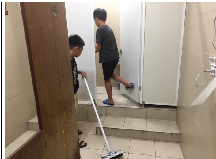
說明:自我照顧課程-學習清潔廁所