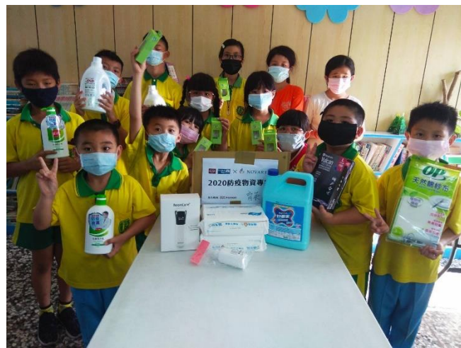
說明:聯合勸募捐贈防疫物資