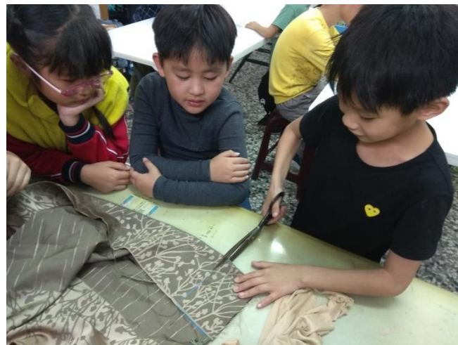
說明:育英多元課程-家政縫紉