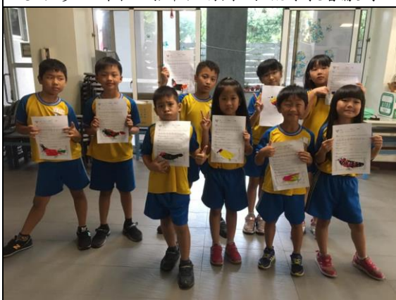
說明:多元課程-閱讀與手作課程。