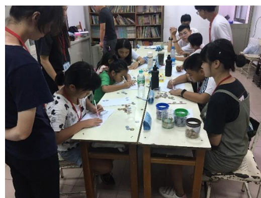
說明:生活教育-理財課程。